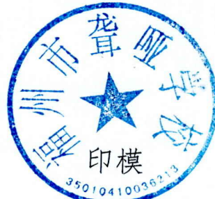
福州市聋哑学校（新印章）